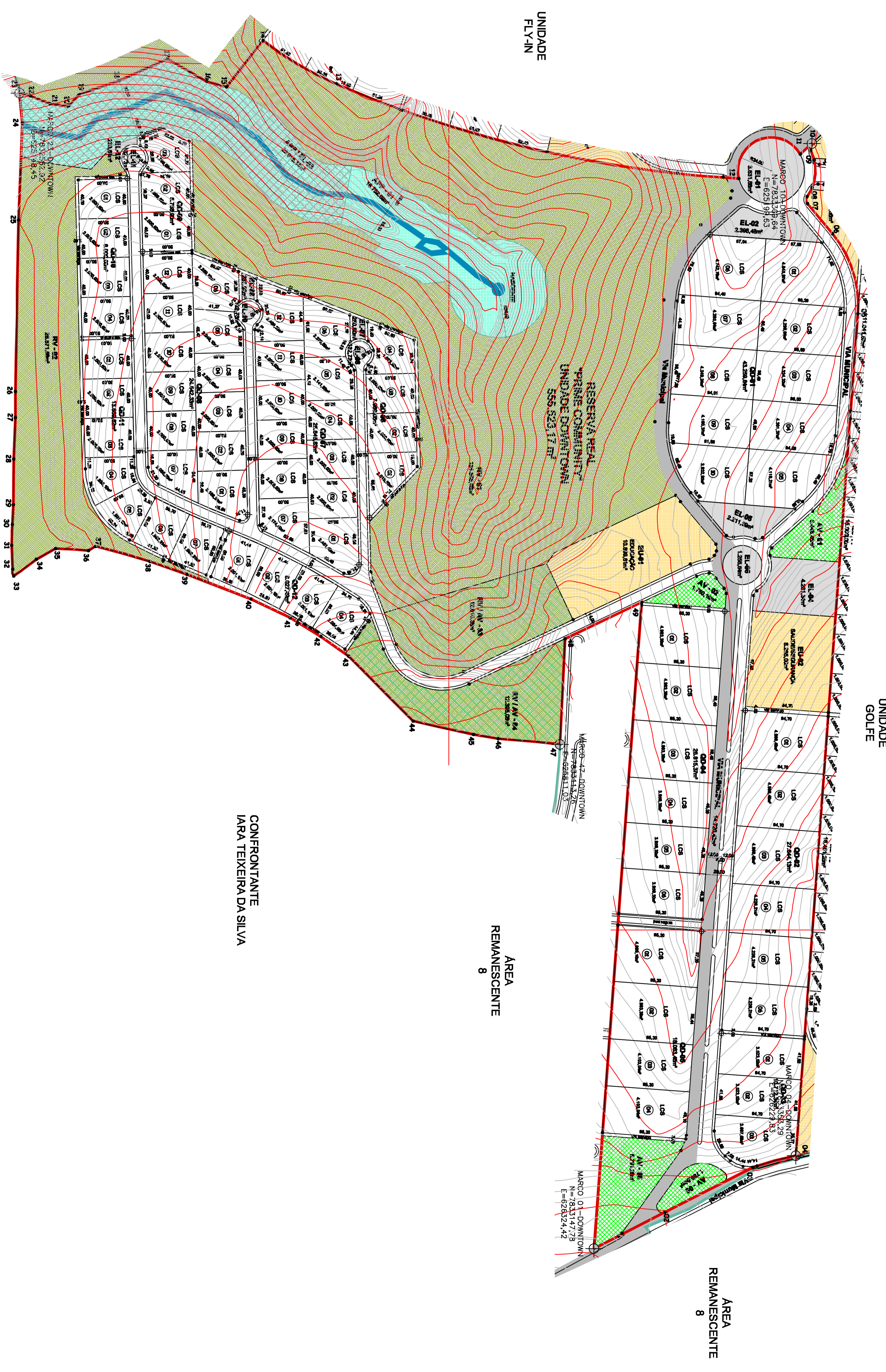
PLANTA - UNIDADE DOWNTOWN escala 1:2000